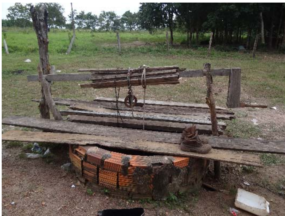
Figura 2. Poço Artesiano em Mata Cavallo/MT